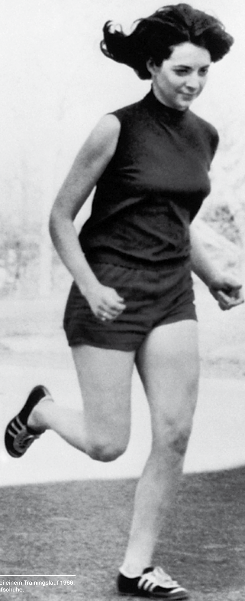
Die 19-jährige Kathrine Switzer bei einem Trainingslauf 1966. Man beachte die ultraflachen Laufschuhe.