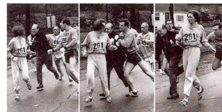
Die Szene ging 1967 um die Welt: Der Renndirektor des Boston-Marathons versuchte Kathy Switzer von der Strecke zu drängen – ihre Begleiter schützten sie.

Dass auch Frauen weit über 50 mit dem Laufen beginnen und noch mit 70 oder 80 Jahren Marathons bestreiten, sieht sie ebenfalls als interessante Entwicklung in den kommenden Jahren.