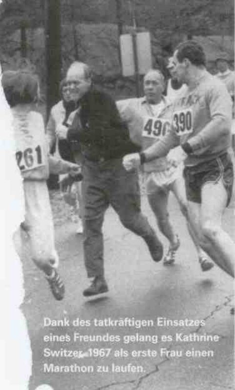
Dank des tatkräftigen Einsatzes eines Freundes gelang es Kathrine Switzer 1967 als erste Frau einen Marathon zu laufen.