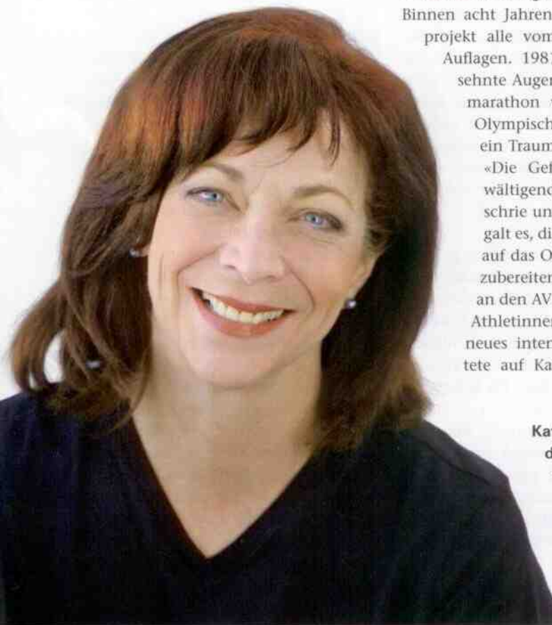
Kathrine Switzer ließ den Frauenmarathon olympisch werden und schrieb damit Geschichte.